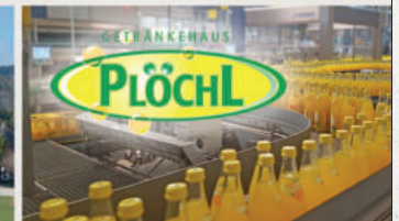
Standort in Kirchdorf i. Wald